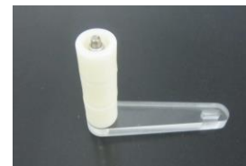
付属のバネ巻きハンドル