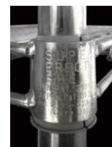
[左]スーパーエレクターシェルフ発売当時の刻印 [右]ヴィンテージシリーズの刻印

古き良きインダストリアルデザインの魅力はそのままに、より現代のインテリアに取り入れやすいデザインにアレンジ。あえてムラを残した塗装で、年月を経たような風合いを醸し出し、味わい深く、重厚感のある空間を演出することができる。刻印はスーパーエレクターシェルフの伝統と信頼を受け継ぐ証として、発売当時の刻印を元にデザイン。