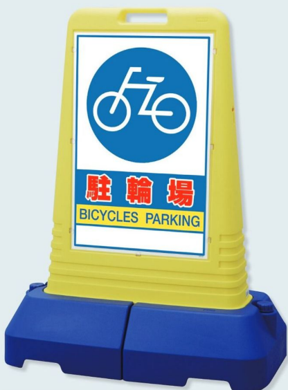
865-451 片面表示 ☆ 865-452 両面表示 ☆