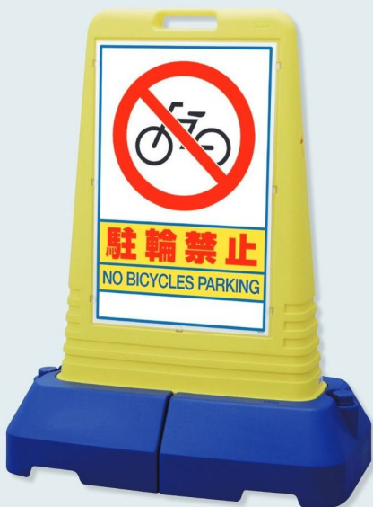
865-421 片面表示 ☆ 865-422 両面表示 ☆