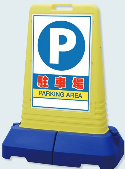
865-441 片面表示 ☆ 865-442 両面表示 ☆