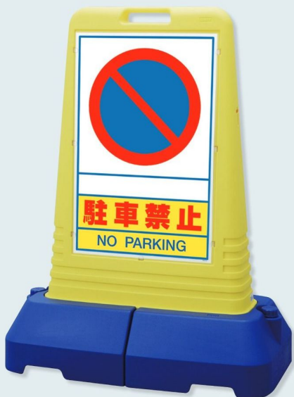
865-411 片面表示 ☆ 865-412 両面表示 ☆