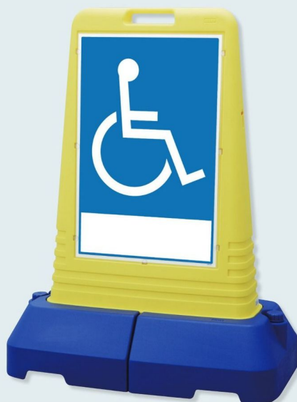
865-461 片面表示 ☆ 865-462 両面表示 ☆