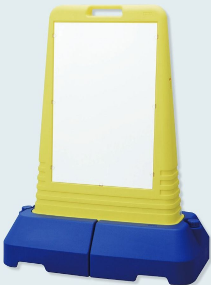
865-471 (白無地) 片面表示 ☆ 865-472 (白無地) 両面表示 ☆