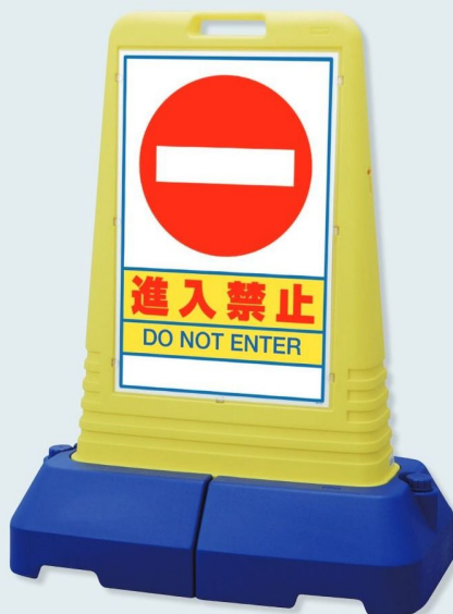
865-431 片面表示 ☆ 865-432 両面表示 ☆