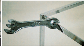
専用レンチでひねる。