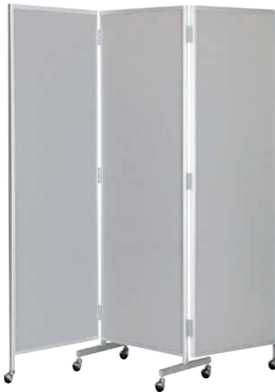
櫛-88C (グレー) JAN 068564