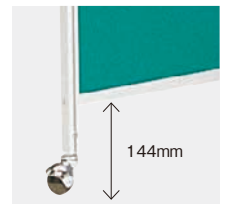
床面からパネルまでの高さは144mmです。