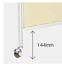
床面からパネルまでの高さは 144mmです。