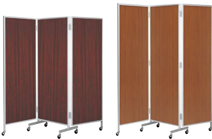
楯-66 (ローズ) JAN 049952