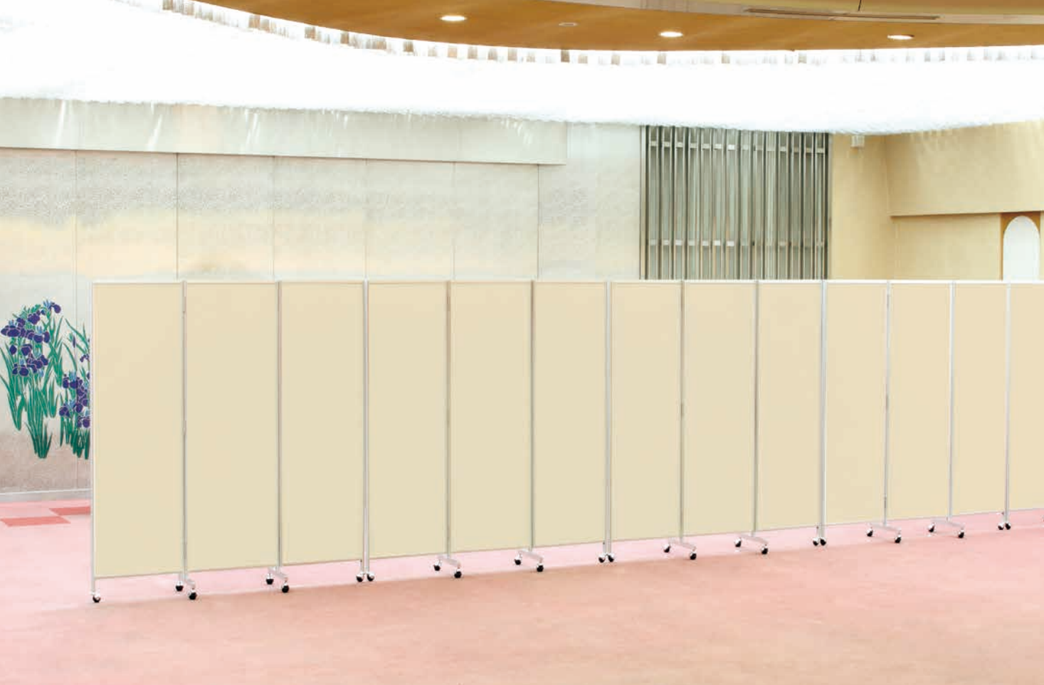
写真は楯-88(アイボリー)