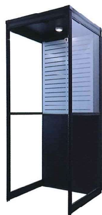
スマートミニ(ガラスver.)