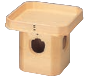
三宝(ひのき) 18-456-10 (61350) 6寸 4,050円 約18.7×18.7×H16.1cm 18-456-11 (61351) 7寸 5,250円 約22.1×22.1×H17.9cm 18-456-12 (61352) 8寸 7,450円 約24.9×24.9×H19.9cm 18-456-13 (61353) 9寸 11,500円 約27.9×27.9×H22cm 18-456-14 (61354) 尺 17,300円 約31.3×31.3×H23.9cm