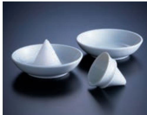
盛塩セット(盛塩器1ヶ・皿2枚付) 18-456-16 (21560) 1,300円 出来上り：約φ4×H4cm 皿：約φ9.6×H2.4cm ※塩は付いておりません。

◆ 盛り塩の由来と作り方 ◆ 盛り塩とは粗塩などを三角錐に盛り、飲食店の玄関先や一般家庭の水廻り付近などに置く風習で、主に商売繁盛、縁起担ぎ、厄除け、魔除けなどの意味を持ち、中国の故事に由来すると言われていました。作り方は粗塩(一般の塩でもよい)を霧吹きなどで軽く湿らせてから、盛り塩器に詰め皿の上に伏せますと形のよい円錐形の盛り塩が出来ます。