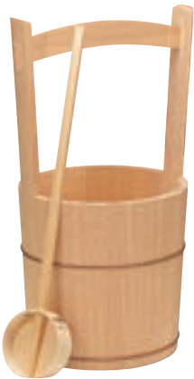
墓参桶ひしゃく付 18-456-15 (61320) 27,400円 手桶：約φ25×H50(24.5)cm ひしゃく：約φ9.5×H3.5×L51cm(約180cc)