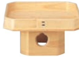
遠山三宝(ひのき) 受注 18-456-05 (61406) 6寸 3,950円 約18.7×18.7×H10cm 18-456-06 (61407) 7寸 5,150円 約22.1×22.1×H11cm 18-456-07 (61408) 8寸 7,350円 約24.9×24.9×H13cm 18-456-08 (61409) 9寸 11,000円 約27.9×27.9×H14cm 18-456-09 (61410) 尺 16,000円 約31.3×31.3×H16cm ※高さを抑えた形状です。