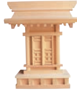
一社唐戸(木曾ひのき) 受注 18-456-01 (61398) 小 11,000円 約30×14×H34cm 18-456-02 (61399) 中 11,500円 約34×15×H38cm ※写真の商品は小です。

◆ 盛り塩の由来と作り方 ◆ 盛り塩とは粗塩などを三角錐に盛り、飲食店の玄関先や一般家庭の水廻り付近などに置く風習で、主に商売繁盛、縁起担ぎ、厄除け、魔除けなどの意味を持ち、中国の故事に由来すると言われていました。作り方は粗塩(一般の塩でもよい)を霧吹きなどで軽く湿らせてから、盛り塩器に詰め皿の上に伏せますと形のよい円錐形の盛り塩が出来ます。