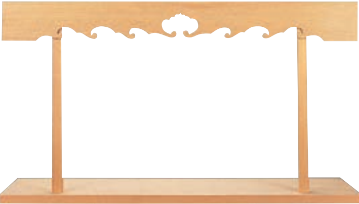
檜葉・新寸用棚板セット 受注 18-456-04 (61342) 50,000円 約80×36×H50cm ※材質ヒバ