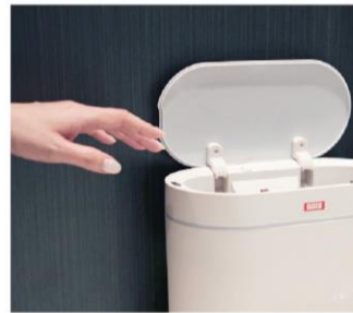
センサー式自動開閉