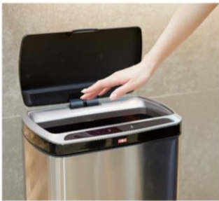
センサー式自動開閉