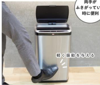
振動感知式自動開閉