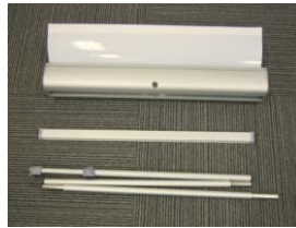
eクル II 600