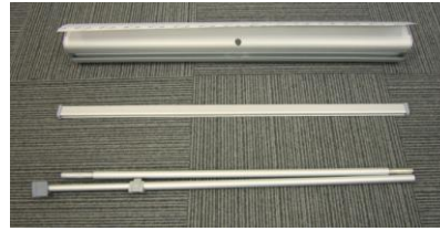
eクル II 850