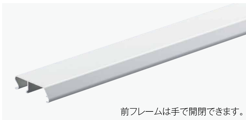
前フレームは手で開閉できます。