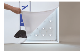
エッジライトタイプ