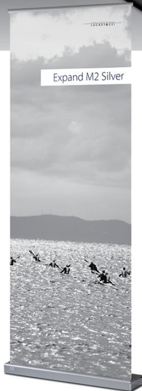
Expand M2 Silver