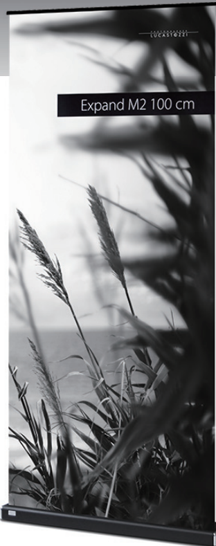
Expand M2 100 cm