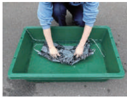
水に浸しながらよく揉みます。