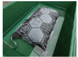
水に浸して約90秒※で膨らみます。