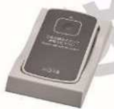
カード型送信機 STR-CG-HD 試着室の壁に設置が可能。