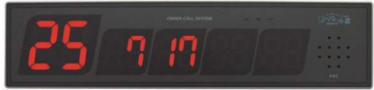
片面/両面受信表示機 SRE-K/R 番号を表示する受信表示機。 遠くからも見やすいデザインで、チャイムの種類は14種類。 番号はナンバー消し機や、携帯受信機、タイマーで消すことができます。