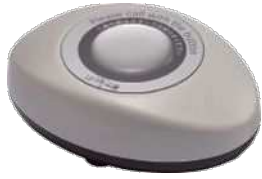
スリム型送信機 STR-S 拡張性の高い送信機

特定小電力無線なので簡単設置・簡単移設。 見通し距離100m。無線の中継機もあります。