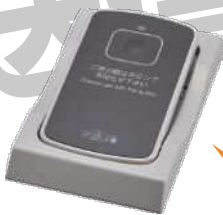
カード型送信機 STR-CG-HD 壁やテーブル下の設置が可能。