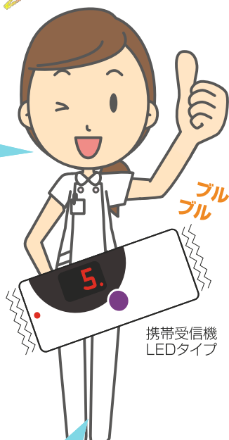
携帯受信機 LEDタイプ