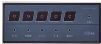
ナンバー消し機 SER-1 表示された番号を 任意で消去できます。

パイプでお知らせ。手元で確認できます。 Functionボタンを押すと表示している番号が消去されます。