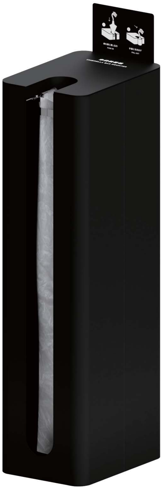
①本体・装着機・ブラック 362-0432