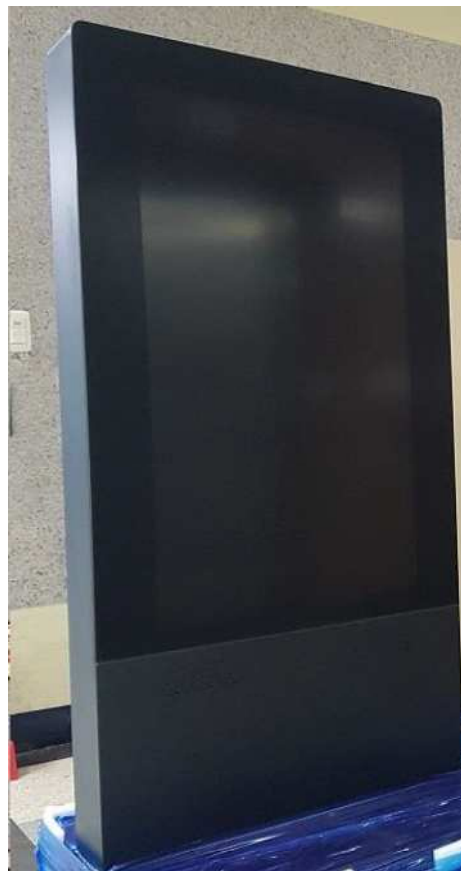
前面左右にパンチングのスピーカー穴があります。 10w×2個となります。