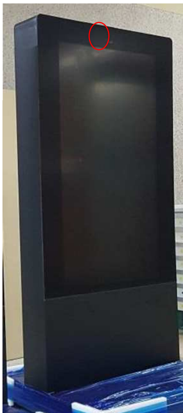
上部赤丸部にリモコン受光部があります。