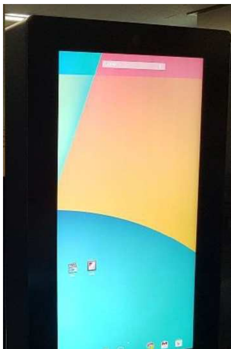
強化乱反射防止ガラス(5mm)を採用しております。 視野角は178度となります。