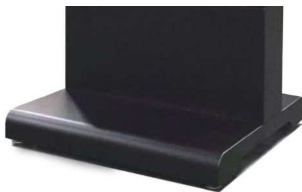
台座の仕上がりです。 台座下にはキャスター(ストッパー付)がついています。