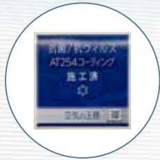
AT254 コーティング 施工済みステッカー貼付