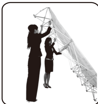
④ 上部は本体を傾けながら、全てのストッパーを固定して下さい