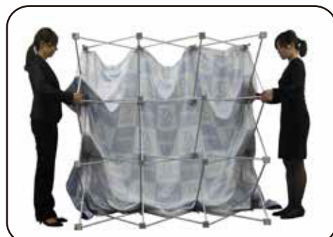
③ 絶対に無理に力を加えないで下さい