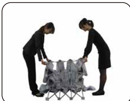
② 本体をゆっくりと広げて下さい