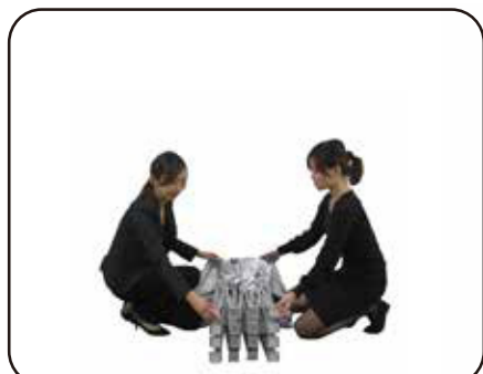
① 収納バッグから取り出して下さい